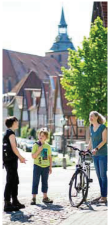
Das Titelbild der neuen Broschüre der Zukunftsstadt.

Lüneburg. Die Zukunftsstadt gibt es jetzt auf einen Blick. Die neue Broschüre „Deine Zukunft – Deine Stadt“ stellt euch die 15 Experimente vor. Mit einer Armbewegung klappt man das kleine Heftchen auf und sieht, was das Bürgerbeteiligungsprojekt im Angebot hat, um den sperrigen Begriff Nachhaltigkeit in Lüneburg erlebbar werden zu lassen. Dazu gibt es eine Menge Infos und Ansprechpartner*innen mit Kontakten. Die Broschüre kann während der Wandelwoche am Stand der Zukunftsstadt abgeholt werden oder ist ab nächster Woche im Büro der Zukunftsstadt (Waagestraße 1 in Lüneburg) erhältlich.